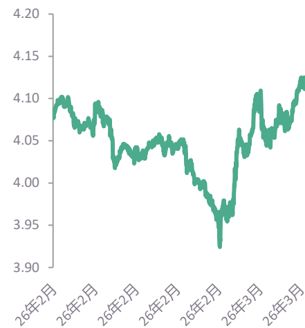
10年期美国国债收益率